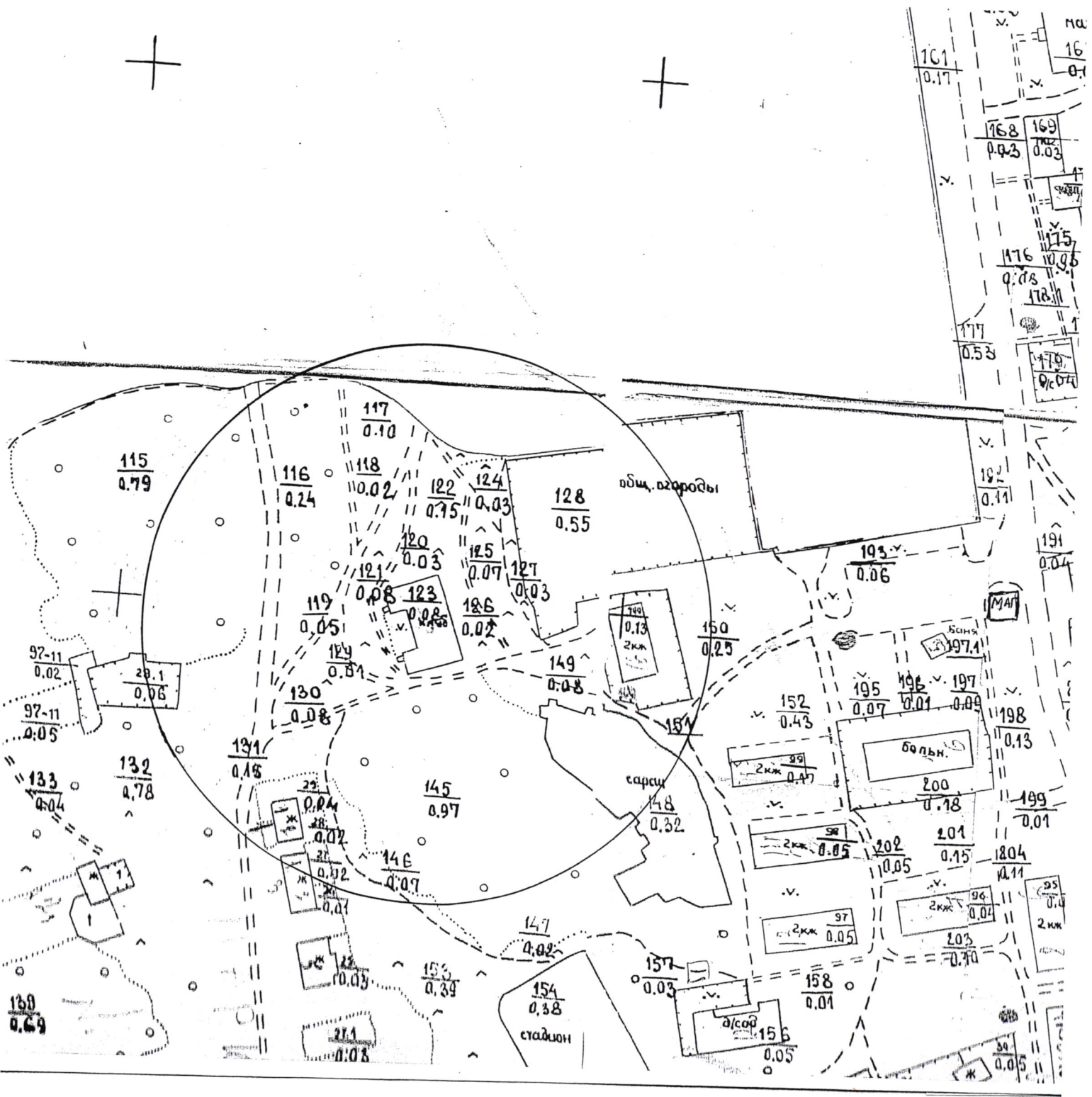
Схема Границ прилегающей и обособленной территории Сельского дома культуры С. Вознесенье, ул. Центральная, д.17