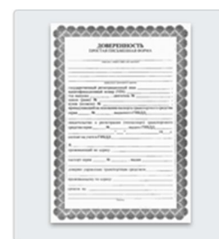
Если вы не родитель — доверенность или другой документ, подтверждающий право предоставлять интересы ребенка