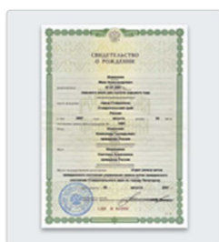
Свидетельство о рождении ребенка